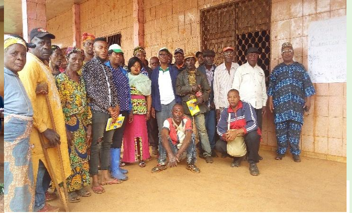
Photos de famille à la fin des sessions de formations