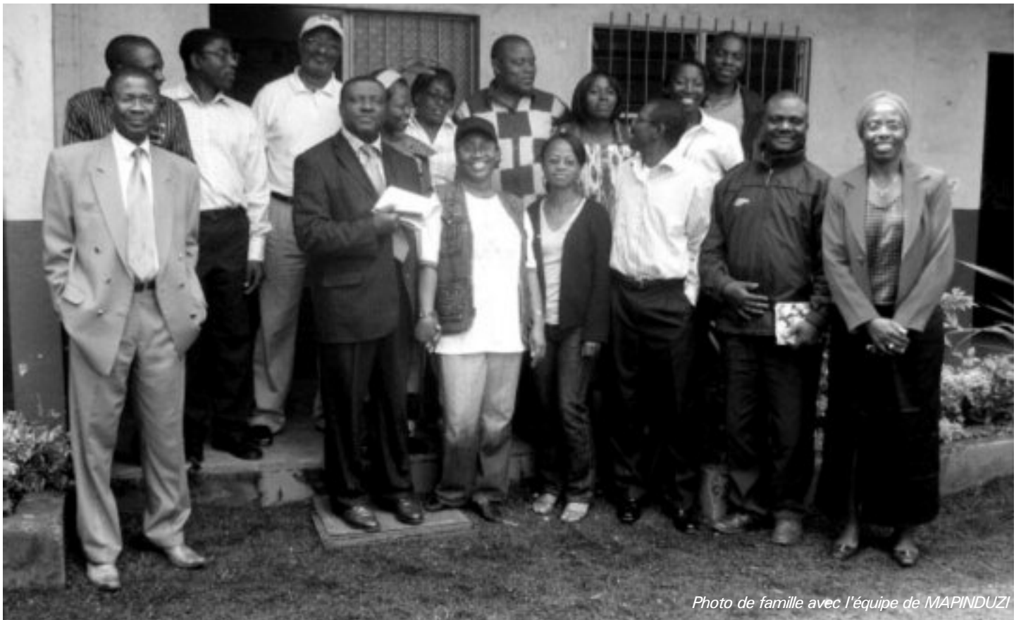
Photo de famille avec l'équipe de MAPINDUZI

Le deuxième axe de suivi-accompagnement du CIPCRE-Cameroun a concerné le processus de mise en place du projet Lutte contre le Changement Climatique et la pauvreté dans la région de l'Ouest.