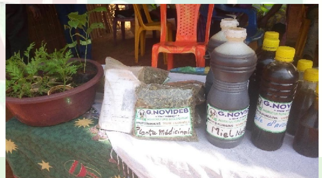
G.NOVIDEB A L'AM DU CIPCRE Quelques PRODUITS exposés