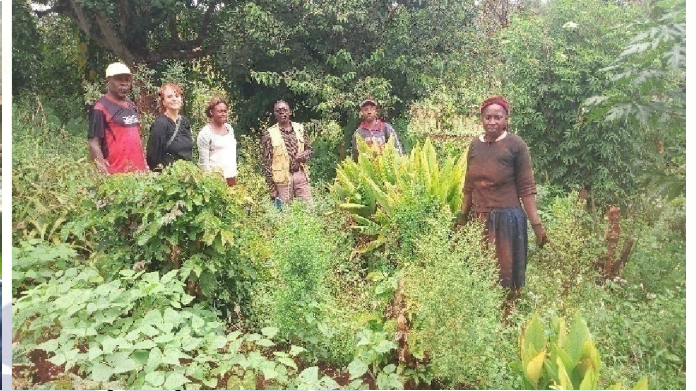
(DM SUISSE) VISITES PAR LES PARTENAIRES DE QUELQUES PÉPINIÈRES