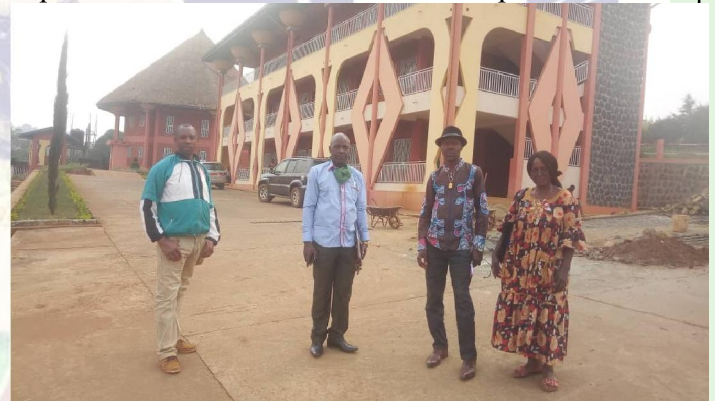
Délégués du G.NOVIDEB à l'AM du CIPCRE

-La visite du consultant résident au Cameroun de Pain pour Le Monde (PPLM) en Mars et du représentant de DM/ CIPCRE en Septembre.