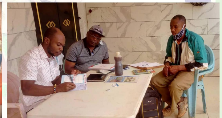
Entretiens avec les évaluateurs de « PAIN POUR LE MONDE »