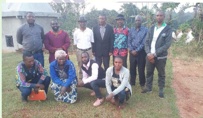
Après la Validation du Plan d'Action 2021

L'association qui au début n'était portée que 22 personnes relais qui étaient les seuls à mener des activités implantées dans trois villages par le CIPCRE voit de nos jours de nombreuses autres personnes issues des 13 villages du groupement s'intéresser chacune dans l'une de ses activités, obligeant ainsi ces personnes relais à se mouvoir pour accentuer sensibilisations, formations, suivis et même dans les groupements voisins, grâce à ce comité de suivi.