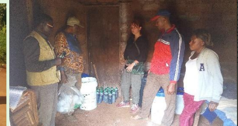
PHASE PRATIQUE DE FABRICATION PAYSANE DES BIO PROTECTEURS et FERTILISANTS