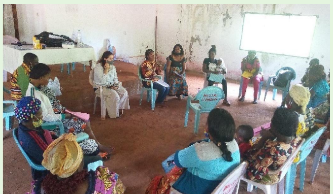
Séances de sensibilisation sur l'entrepreneuriat local (Projet ELLE)