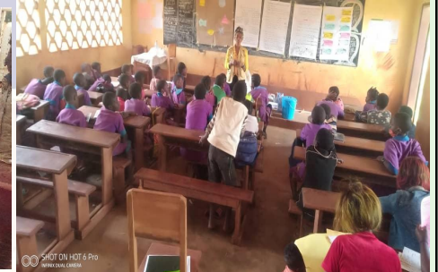
ATELIERS PRATIQUES DANS LES ÉTABLISSEMENTS SCOLAIRES DE BAMDENJO