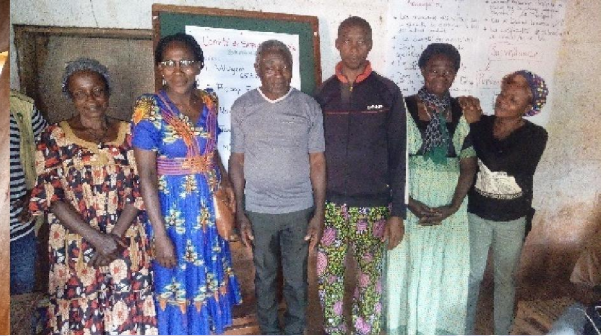
Formations au SPG (SYSTME PARTICIPATIF DE GARANTIE)