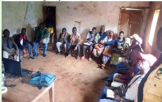
Participation à une séance de formation sur le SPG

* PROFOCAP (Projet de Formation des Conseillers Agro Pastoraux en Agro écologie) qui a facilité la formations des producteurs à l'agro écologie , la fabrication des bio protecteurs et bio fertilisants organiques