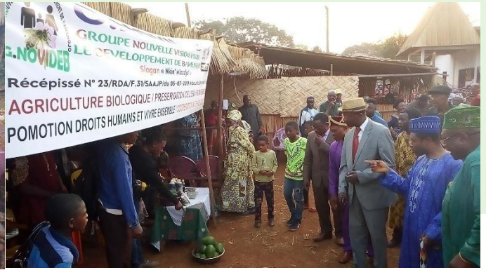
Participation au Nooh Ngong 2021 à BAMBENDJO