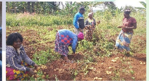
Mise en œuvre et transmission des acquisitions lors des formations