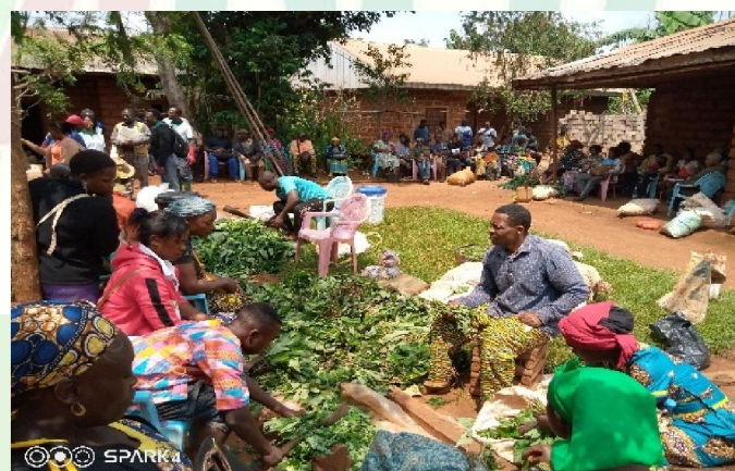
Atelier de fabrication des bios protecteurs