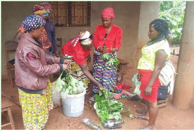
Fabrication du bio fertilisant liquide (EM Indien)