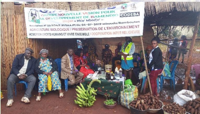
Participation au Nooh Ngong 2021