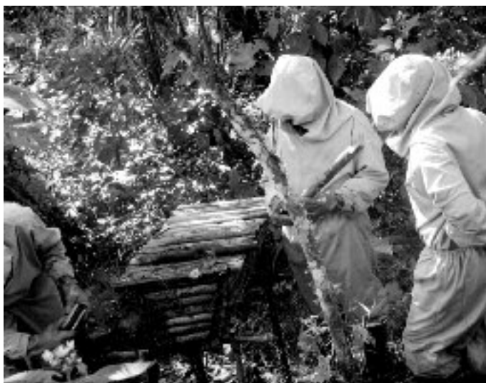
Inspection des ruches par des apiculteurs

commercialisation de trois produits. Et d'abord sur la production et la commercialisation des plantes médicinales auprès de 57 producteurs dont 35 femmes dans 5 localités. De l'analyse des données collectées, il est ressorti que les producteurs des plantes médicinales sont âgés de 25 à 45 ans ; qu'ils exploitent des superficies variant entre 200 et 300 m 2 ; qu'ils pratiquent cette activité secondaire pour satisfaire les besoins familiaux ; que sur les 46 espèces cultivées, 26 % seulement sont des espèces locales ; que les seules méthodes de transformation que 90 % des producteurs connaissent sont le séchage des feuilles et des fleurs, la préparation des infusions et la transformation des racines en poudre ; que le matériel de conditionnement est rudimentaire, ce qui aboutit à l'obtention des produits finis de moindre qualité et peu concurrentiels sur le marché ; que les produits vendus sont les feuilles et les fleurs séchées, la poudre des racines, les plantes fraîches, les jeunes plants et les infusions et qu'ils sont écoulés par 30 % des producteurs à l'occasion des grands événements dans leurs localités ; que les paysan(ne)s ne tiennent pas de compte d'exploitation ni de fichier de clients, ce qui rend difficile l'évaluation de la rentabilité de cette activité.