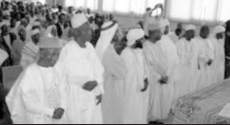
Installation de la Dynamique Islamique JPSC

tives, les Dynamiques Protestante et Islamique JPSC ont eu à mener des activités auprès des commissions placées sous leur responsabilité. C'est ainsi que la DIJPSC de l'Ouest a organisé une rencontre de sensibilisation à la Mosquée Centrale de Fouban au profit de 22 personnes dont 8 femmes pour présenter ses objectifs et ses grands axes d'action. Le 31 mai, les fidèles de la Mosquée Centrale de Bafang se sont constitués en commissions JPSC. Dans la même semaine, les Commissions JPSC de la Mosquée Imam Malik et celle de la Mosquée Centrale de Bafoussam ont organisé 3 rencontres de sensibilisation en leur sein au profit d'environ 150 personnes, hommes et femmes confondus. Les capacités des fidèles de ces Mosquées ont été renforcées à travers 2 conférences sur le thème Justice Paix et Sauvegarde de la Création. Une conférence sur " Tolérance par le dialogue interreligieux " a été en outre organisée au bénéfice de la Mosquée Imam Malik de Tamdja.