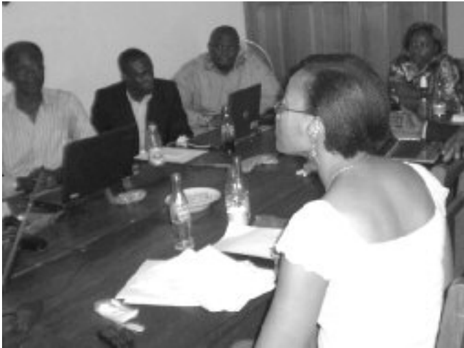
Réunion du Comité d'organisation de la FIC & IT

La Fête de l'Internet au Cameroun a été rebaptisée FIC & IT. Après ce changement, nombre d'activités de préparation de la FIC 2009, parfois achevées, ont été mises à plat et reprises à nouveau : organisation de six rencontres du comité d'organisation ; suivi du dossier marketing et des autres documents chez l'infographe, Olivier EDJANGUE, jusqu'à leur acheminement en imprimerie ; réalisation du shooting pour l'image de l'affiche officielle de la FIC & IT 2010 ; suivi de l'impression du dossier marketing, des cartons d'invitation au cocktail de présentation ; réadaptation du dossier de participation aux nouvelles dates, leur finalisation, leur impression et celle des enveloppes ; réalisation du site internet de la FIC & IT 2010 ; organisation du cocktail de présentation ; prospection et suivi des entreprises s'étant manifestées au cocktail de présentation ; veille relationnelle (comité d'organisation, entreprises, partenaires prospects, etc.) ; développement d'un marketing direct et d'un e-marketing (mailing, newsletter, etc.).