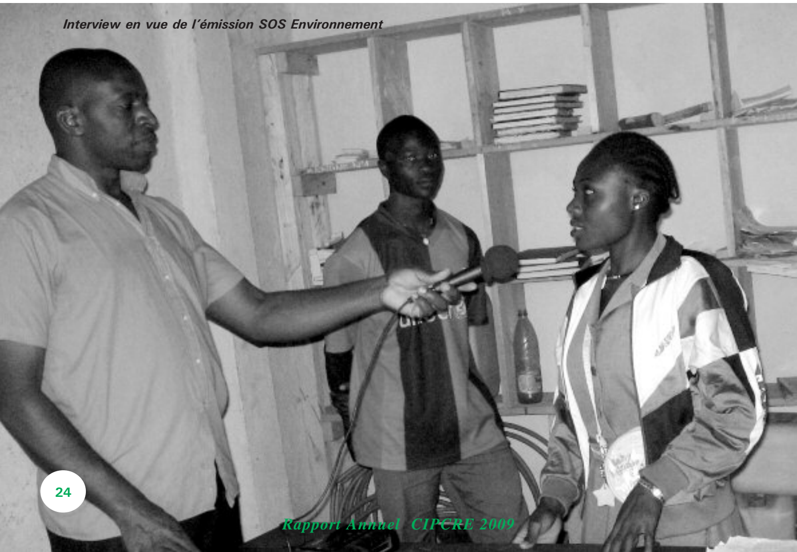
Interview en vue de l'émission SOS Environnement

Le rapport public a été distribué auprès des principales entités de travail du CIPCRE que sont la Direction Générale (500 exemplaires), le CIPCRE-Bénin (500