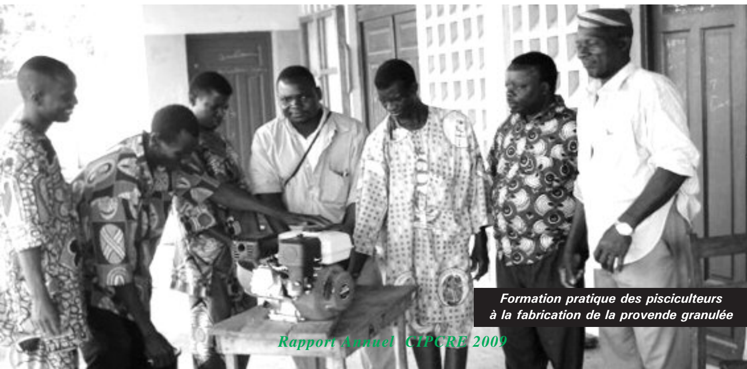
Formation pratique des pisciculteurs à la fabrication de la provende granulée

Les principaux problèmes soulevés par les populations sont la faible capacité de financement des activités par les producteurs (crédit) ; l'absence d'électricité ; l'insuffisance d'infrastructures communautaires ; la dégradation des pistes : digue Akpadon - Hozin et piste Akpadon - Kodji ; l'appauvrissement des plans d'eau en ressources halieutiques notamment les poissons ; l'attaque parasitaire (au champ et post-récolte) ; la mortalité des animaux ; l'insuffisance des points d'eau potable, l'inadéquation et l'insuffisance des latrines.