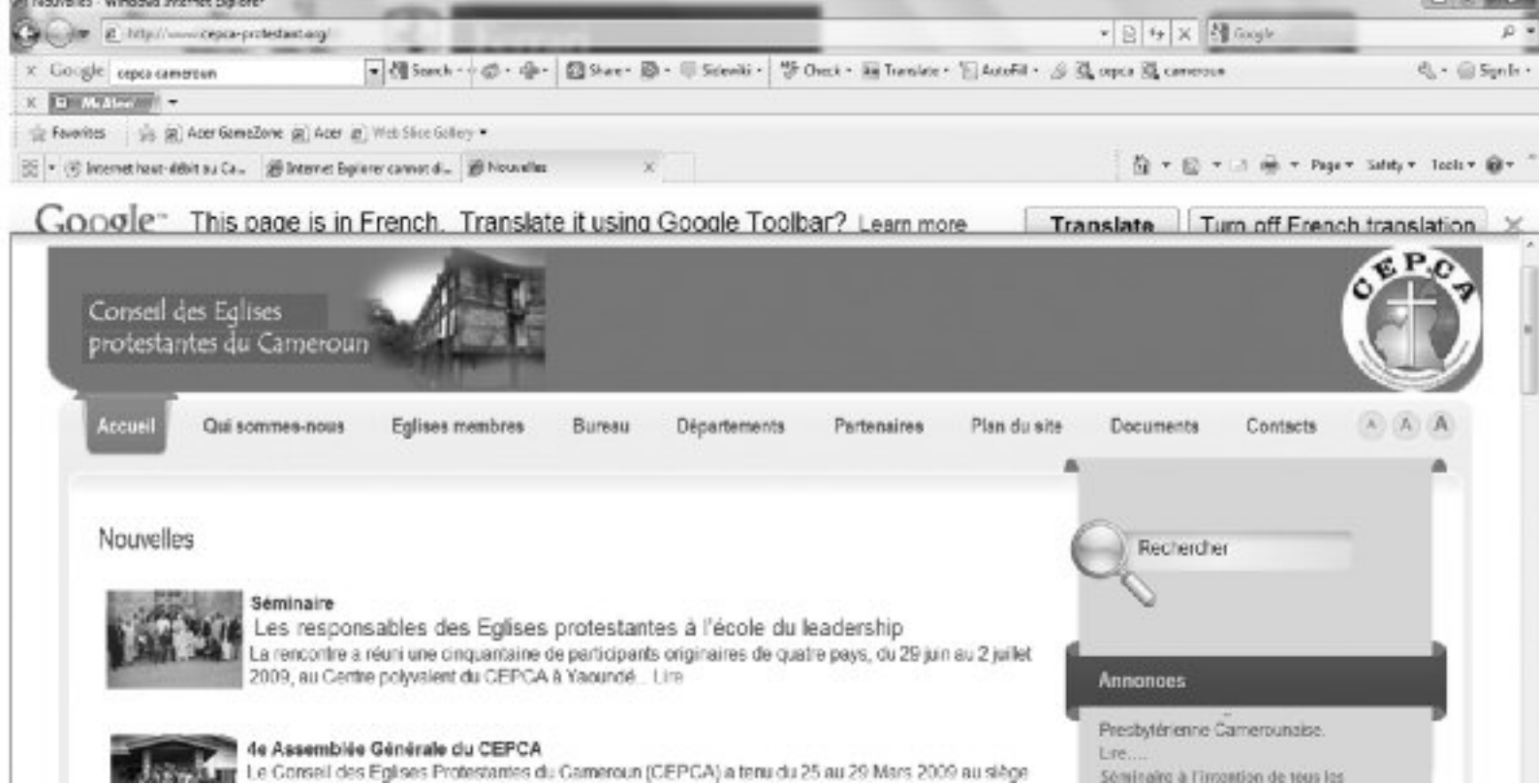
Page d'accueil du site Internet du CEPCA

Internet de l'EEC par exemple, est un indicateur de l'appropriation des TIC par cette Eglise.