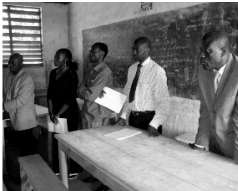
Ouverture de l'enquête sur la citoyenneté au Lycée Bilingue de Baleng

personnes dont 3 membres de la cellule de Communication et de Surveillance de l'Environnement Scolaire de la Délégation Régionale des Enseignements Secondaires et 4 responsables du CIPCRE. Au sortir de cette réunion, il