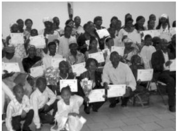
Remise des attestations aux apprenants de la promotion 2008

Au cours de l'année, le support du cours de bureautique a été actualisé. Le matériel pédagogique, conçu à l'aide du pack Microsoft Office 2003, a été remplacé par Office 2007.