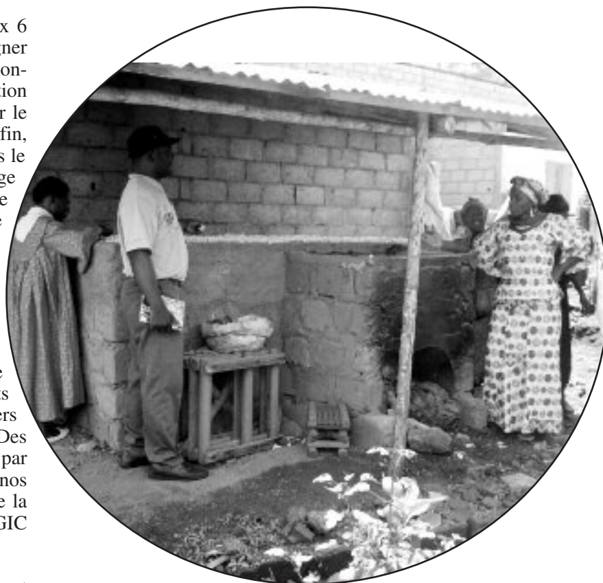
Séchoir communautaire de manioc à Bandja

La visite de suivi des activités des apiculteurs de Ngondzen nous a permis de recenser 15 ruches colonisées par eux installées et de constater que des espèces d'arbres mellifères ont été plantées pour assurer une production soutenue du miel. Cette visite a vu la participation de 25 personnes de la localité avec qui nous avons envisagé d'étendre le rucher. Il a été ainsi décidé que le nombre de ruches installées passera de 15 à 50. Pour ce faire, les membres du comité de gestion de l'eau se sont entendus avec les autres membres de la communauté présents pour répartir la zone de captage de la source d'eau entre les apiculteurs et les nouvelles personnes qui désirent s'impliquer dans l'activité d'apiculture.