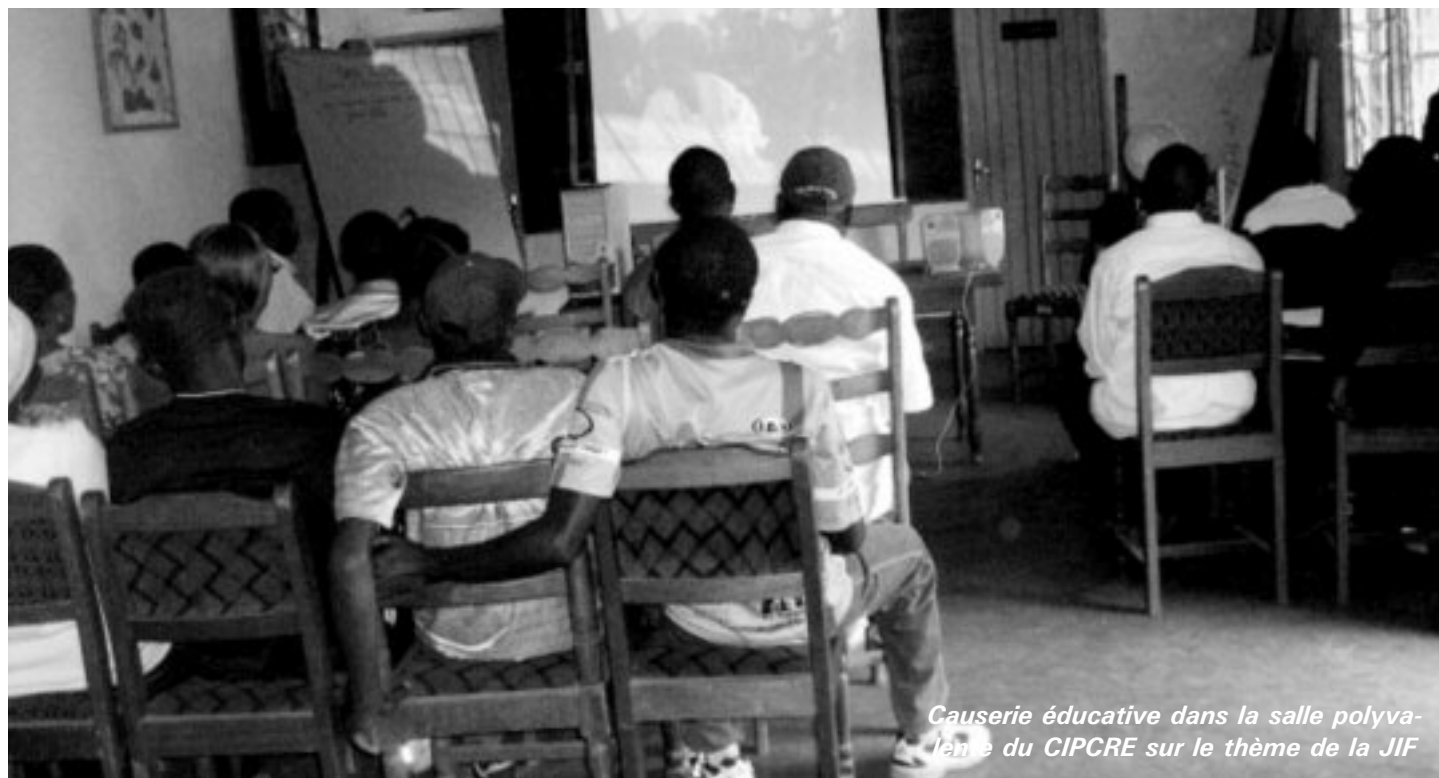
Causerie éducative dans la salle polyvalente du CIPCRE sur le thème de la JIF

L'évaluation prospective de la Direction Générale et du CIPCRE-Cameroun a fait de la promotion de trois thématiques transversales un impératif majeur pour l'organisation : la thématique " souci de l'écologie ", la thématique " souci genre " et la thématique " souci de la citoyenneté et de la bonne gouvernance ". Ces thématiques ont, tout au long de l'année de référence, irrigué nos activités aussi bien au Cameroun qu'au Bénin et à la fois sur les plans institutionnel et opérationnel.