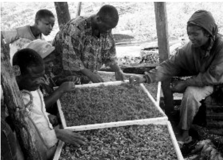
Conditionnement de l'artémisia annua et du plantain

Afin de renforcer les capacités des producteurs des plantes médicinales, nous avons réalisé des visites de suivi dans les jardins des GIC IDASS de Mantum et ATWID Kongadzem et à l'orphelinat de Batibo. Pour corriger les insuffisances constatées, une session de formation a été organisée au profit de 20 personnes dont 15 femmes constituées des pensionnaires de la structure, des paysans et du volontaire du Corps de la Paix de la localité. Les participant(e)s ont pu ainsi se familiariser avec les techniques de récolte et de séchage des plantes médicinales et de leur conservation. Suite à cette formation, un appui constitué de 124 plants de 11 espèces de plantes médicinales a été apporté aux pensionnaires de l'orphelinat. Des fientes de poules et des plants d'Artemisia ont été apportés en appui aux membres du GIC ATWID Kongadzen sur leur demande.