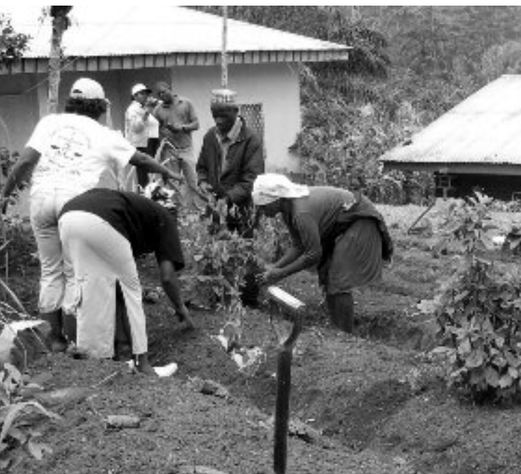
Plantation de jeunes plants d'arbres à Ngondzem

Nous avons enfin organisé une campagne de reboisement dans la localité Ngondzen. Elle a mobilisé 25 habitants dont 4 femmes. Grâce à cette mobilisation, 225 arbres ont été plantés pour la protection de la zone de captage de la source d'eau qui alimente le village.