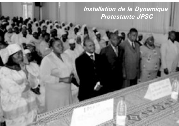
Installation de la Dynamique Protestante JPSC

Notre appui a également permis à la CPJPSC de Njimbam d'organiser des tournées de sensibilisation dans ses annexes, avec pour résultat, l'enregistrement de nouvelles inscriptions dans la commission ; la commission JPSC Plateau a effectué une visite de sensibilisation et