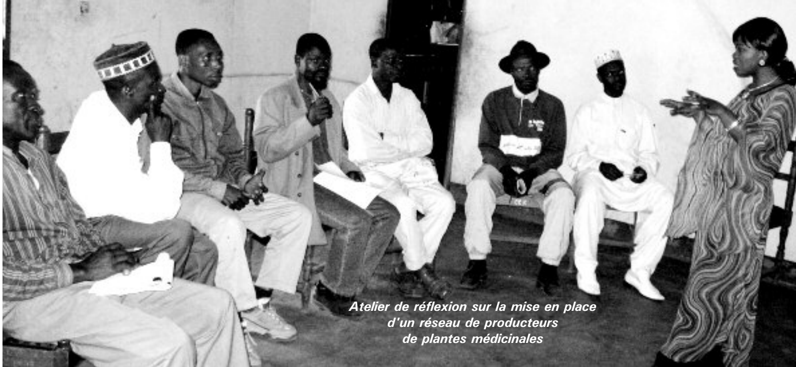
Atelier de réflexion sur la mise en place d'un réseau de producteurs de plantes médicinales

occasion, un marché d'informations a été organisé, ce qui a permis aux participant(e)s d'exposer leurs produits, d'échanger sur les initiatives prises pour écouler et prendre conscience du fait qu'il existe de nombreuses opportunités de vente. Cette prise de conscience a été à l'origine de la décision de mettre sur pied une plate forme d'échanges d'informations et d'expériences des producteurs de plantes médicinales. Un comité chargé de réfléchir sur les mécanismes de cette plate forme a été créé. Le deuxième atelier a réuni les 7 membres désignés à cet effet. Sous notre impulsion, ils ont poursuivi la réflexion sur la nécessité de créer un réseau pour la défense de leurs intérêts. Au sortir de l'atelier, ils ont convenu de la nécessité de se retrouver pour élaborer un statut et un règlement intérieur qui seront soumis à l'Assemblée Générale des producteurs des plantes médicinales pour amendement et adoption.