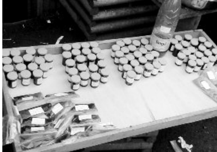
Produit fini de plantes médicinales prêt à la commercialisation

Nous avons enfin réalisé un état des lieux sur l'élevage des cailles dans la région de l'Ouest auprès des services déconcentrés de l'Etat chargés de l'élevage et des éleveurs des 8 départements. De nos investigations, il est ressorti que 60 personnes dont 15 femmes pratiquent cette activité ; que ces éleveurs évoluent de façon indivi-