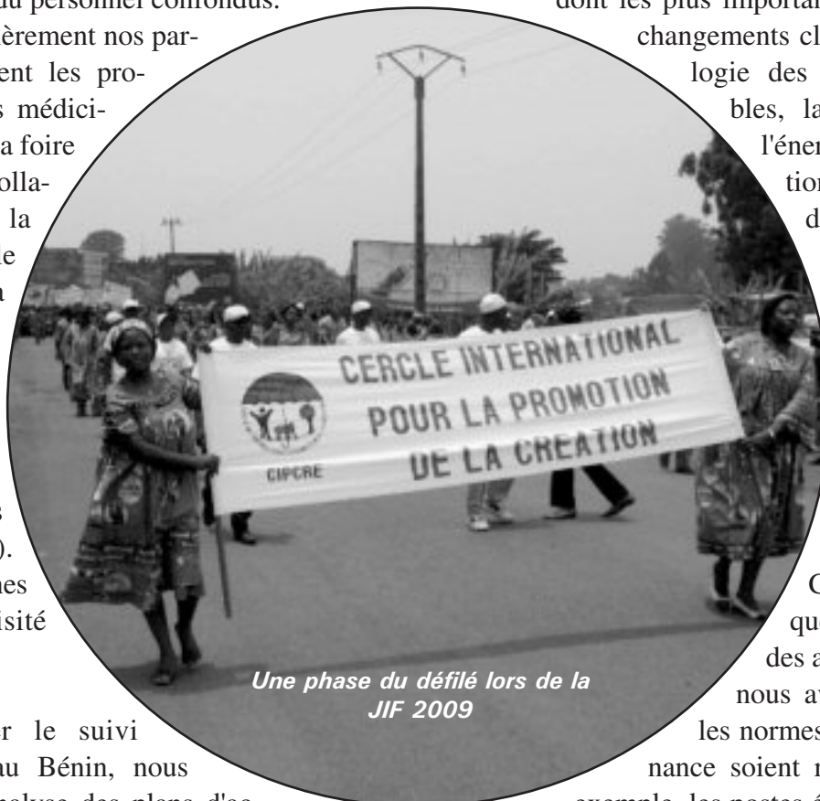
Une phase du défilé lors de la JIF 2009

Dans la vie institutionnelle du CIPCRE aussi bien que lors de la conduite des activités sur le terrain, nous avons veillé à ce que les normes de la bonne gouvernance soient respectées. Ainsi par exemple, les postes électifs dans les groupements paysans et les dynamiques JPSC que nous encadrons ont été conquis suivant les règles de l'art. Il en va de même de la gestion financière de ces structures dont l'orthodoxie a été suivie et renforcée. Les observatoires de la citoyenneté installés dans les établissements scolaires sous contrat vert ont été d'un appoint non négligeable à l'inculcation de la culture citoyenne en milieu jeune. Ils ont activement contribué à la lutte contre la tricherie, la paresse et la violence et pour le respect du bien public, la tolérance et le dialogue dans le microcosme scolaire.