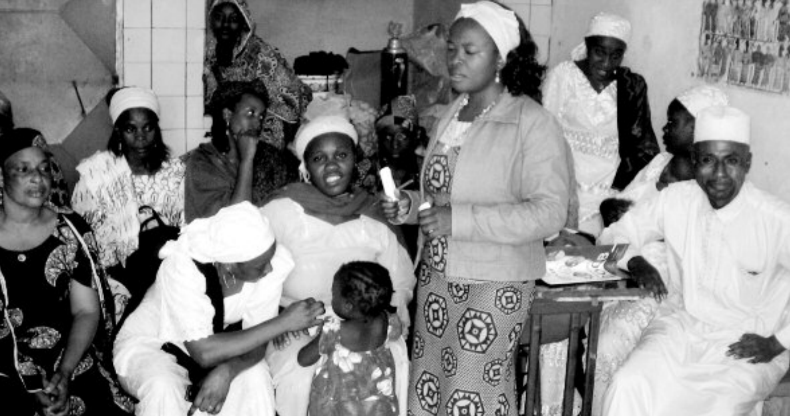
Quelques apprenantes bénéficiaires du projet de formation des jeunes musulmanes

tres de suivi-évaluation. Nous avons en plus organisé à leur intention ainsi qu'à celle de leurs parents un atelier d'échange en vue de renforcer leur assiduité aux formations et accroître leur contribution financière aux activités du projet. Vingt sept (27) personnes ont pris part à cet atelier et pris des résolutions appropriées.