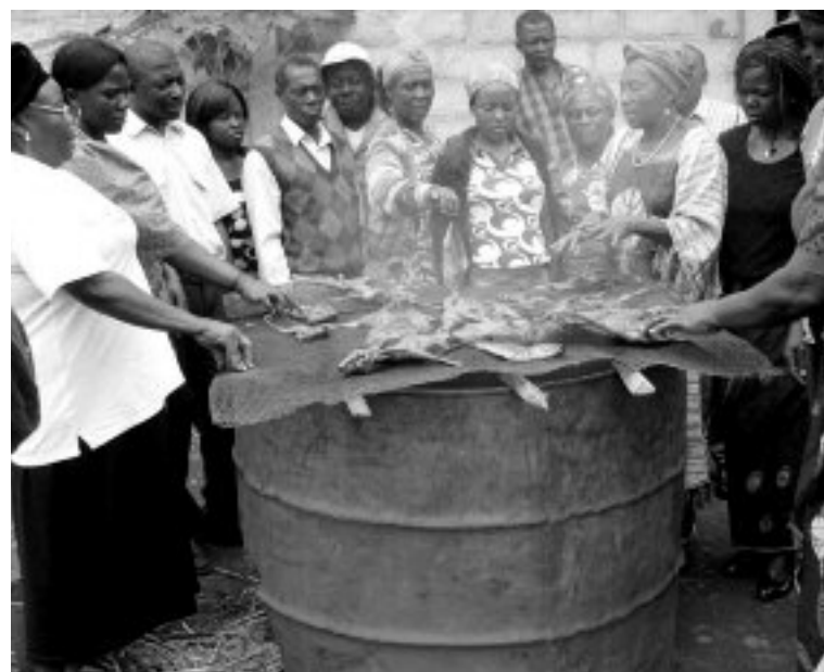
Formation en technique de fumage des produits d'élevage

En vue de leur faire acquérir les techniques écologiques de transformation, nous avons organisé une session de formation au profit de 17 éleveurs d'aulacodes et de lapins parmi lesquels 9 femmes à la ferme pilote d'élevage des aulacodes de Bafoussam sur les techniques de fumage. Le suivi de cette formation a montré que 16 des 17 éleveurs formés ont mis en pratique les enseignements reçus, fumant les produits de leurs fermes et même du poisson frais acheté au marché. Nous avons donné des appuis pour la construction des séchoirs solaires à l'intention de 24 cultivateurs/trices de plantes médicinales dans les localités de Bangang-Fokam et de Tchouandem ; apporté un appui à l'union des femmes de Bandja (qui compte 16 membres) pour la construction d'un séchoir à manioc dont la capacité journalière de séchage est de 100 kg de manioc ; organisé une session de formation pour 15 paysans cultivateurs des plantes médicinales dont 4 hommes à Tchouandeng sur la transformation des plantes récoltées et séchées en pommades, teintures, huiles et poudres médicinales. Les échantillons par eux produits seront expérimentés dans le traitement du rhumatisme, de la goutte, des hémorroïdes, de la toux, de la teigne et de