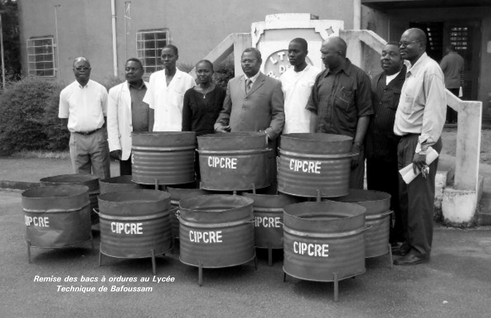
Remise des bacs à ordures au Lycée Technique de Bafoussam

bles et des élèves de ces établissements. De manière globale, les résultats relevés ont montré que des 69 803 arbres apportés en appui, 35 589 ont réussi, soit un taux de réussite totale de l'ordre 51 %. A l'issue de ce suivi-évaluation, les 10 meilleurs établissements ont été sélectionnés et continueront à recevoir l'appui du CIPCRE pour l'extension et l'entretien des espaces verts dans leur campus.