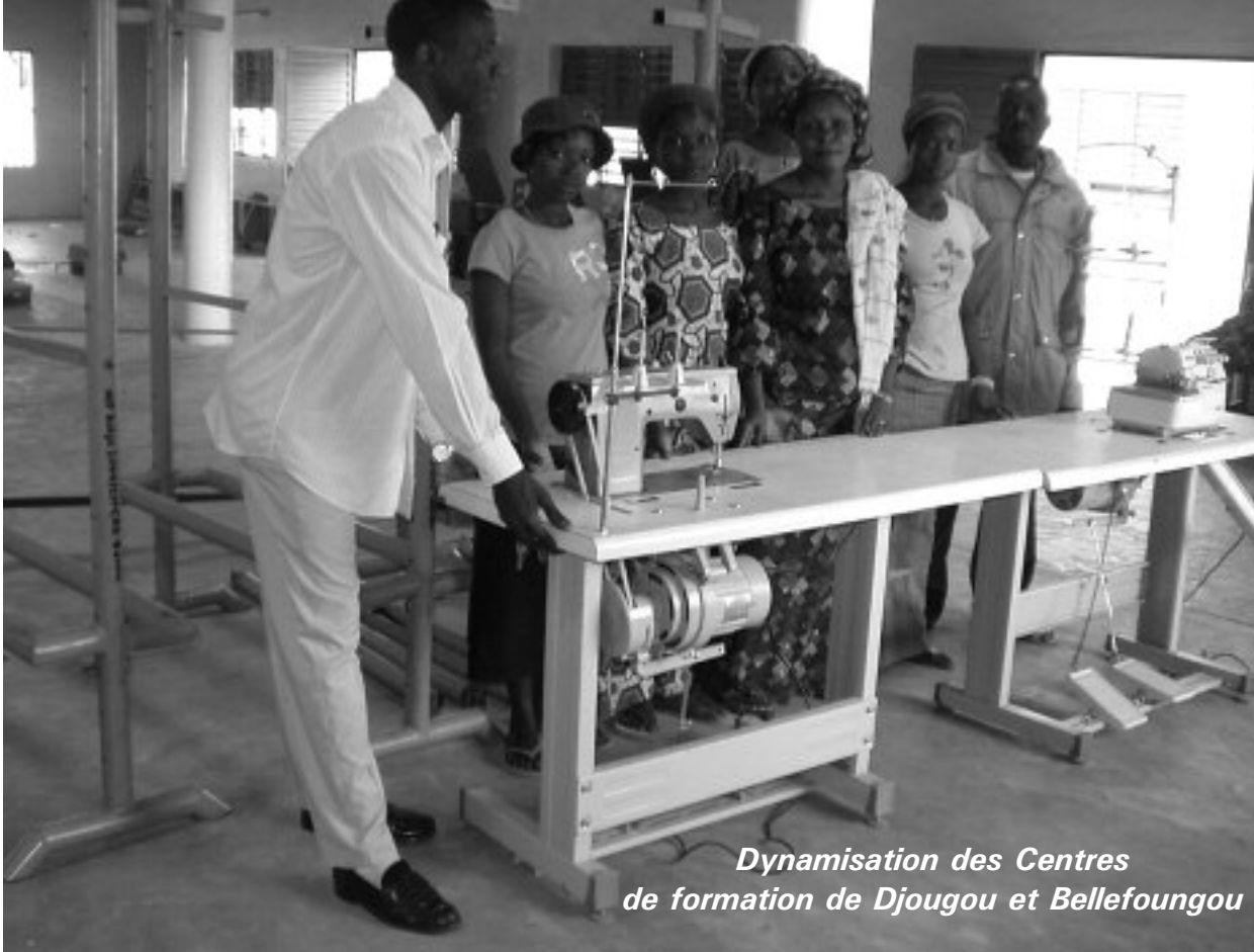
Dynamisation des Centres de formation de Djougou et Bellefoungou

le genre et les droits de l'homme, l'importance du réseautage pour le développement (l'approche BUILD), la gestion des ressources humaines, les stratégies de marketing des produits forestiers non ligneux, le trafic des êtres humains, l'administration des questionnaires et la collecte des données dans le cadre des recherches socio-économiques et la création des instituts agricoles au Cameroun. Ces séminaires, ateliers et conférences étaient respectivement