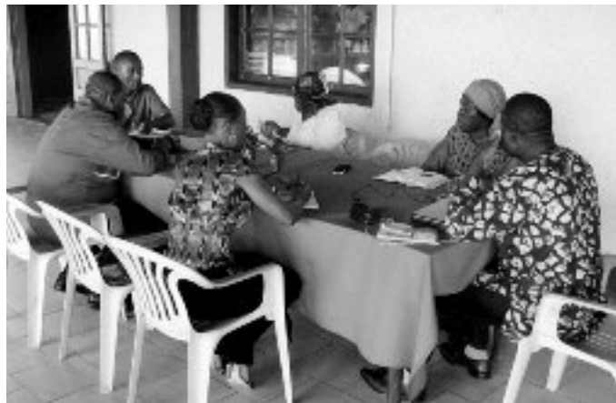
Séance de travail avec le COS de Kribi

taire a été réalisée sur la base de l'étude menée en 2006 par le CERDHESS et intitulée " Dot et rites de veuvage au Cameroun : pratiques sociales et souffrances féminines ". Deux restitutions de ce discours de campagne ont été organisées respectivement dans les villes de Bafoussam et d'Ebolowa avec la participation de 36 personnes dont 18 femmes pour les deux rencontres. Des outils ont été produits pour animer cette campagne : le livret, le power point de présentation, la bande dessinée, une affiche, un tract, un spot radiophonique, des tee-shirts/casquettes et des banderoles.